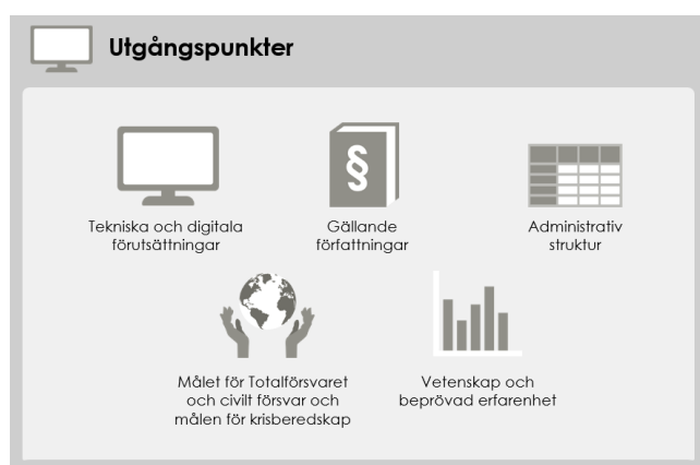
Figur 2. Utgångspunkter för Gemensamma grunder

Tekniska och digitala förutsättningar är ytterligare en utgångspunkt. Det finns tekniska system och vissa krav som både skapar möjligheter och leder till begränsningar, vilket våra arbetsätt, rutiner och checklistor måste förhålla sig till. Utvecklade arbetsätt, rutiner och checklistor kan då samtidigt användas för att ställa krav på teknisk och digital utveckling.