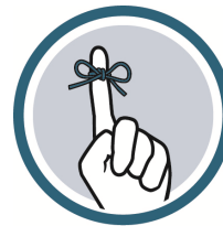
Att tänka på