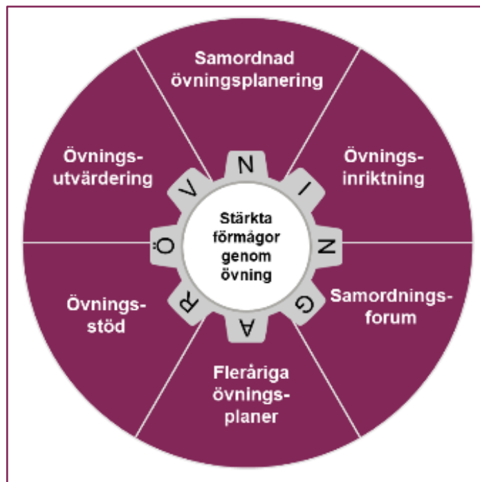
Figur 1 Modell för systematisk övningsverksamhet

Modellen ska ses som en sammanfattning och ett stöd för ansvariga handläggare och beslutsfattare med specifikt ansvar för planering, genomförande och utveckling av övningsverksamhet. Till flera delar i modellen finns underliggande praktiska vägledningar, färdiga övningskoncept och utbildningskomponenter till stöd för ett systematiskt arbetssätt. 6