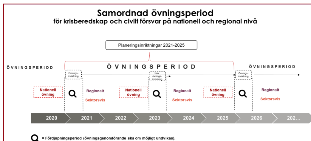
Figur 2 Struktur för samordnad övningsperiod

Det grundläggande konceptet för en samordnad övningsplanering på nationell och regional nivå utgår från en övningsperiod om totalt fem år (60 månader) 7 . Perioden skapar en grundstruktur för övningsverksamheten, som skapar förutsägbarhet, möjlighet till effektivare övningsamordning och som minskar risken för krockar mellan övningar.