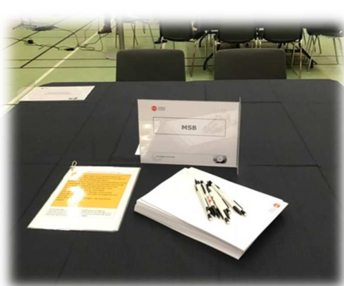
Figur 3 Dukning av övningsbord

Innan de fem övningstillfällena genomfördes fick aktörerna möjlighet att förbereda sig på "hemmaplan" i en distribuerad seminarieövning. Ett antal diskussionsfrågor lades upp på MSB:s övningswebb, och på så sätt kunde drygt 700 övande från de 50 övande centrala och regionala aktörerna ta del av och arbeta med frågeställningarna inför övningen. De deltagande aktörerna tyckte att detta sätt att förbereda sig inför den gemensamma delen var värdefullt.