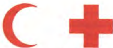
Rött kors/Röd halvmåne Vit bakgrund

Kännetecknen skall användas för identifiering av militära och civila sjukvårds- och materielenheter, sjuktransporter samt sjukvårdspersonal. I kristna länder används det röda korset medan muslimska länder använder den röda halvmånen.