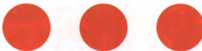
Tre orangefärgade cirklar

Anläggningar och installationer som innehåller farliga krafter skall vara utmärkta med kännetecken. Dammar, vallar och kärnkraftverk får inte anfallas om det kan förorsaka att farliga krafter utlöses och ger upphov till svåra förluster bland civilbefolkningen. Detta skydd kan dock upphöra om anläggningarna eller installationerna används i strid med folkrättens regler.