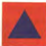
Blå triangel Orange bakgrund

Kännetecknet skall användas för identifiering av byggnader och materiel som används för civilförvarsändamål, personal som tjänstgör inom civilförsvaret samt skyddsrum för civilbefolkningen.