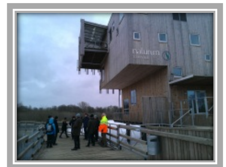
1:a träffen ägde rum i Kristianstad, mars 2013