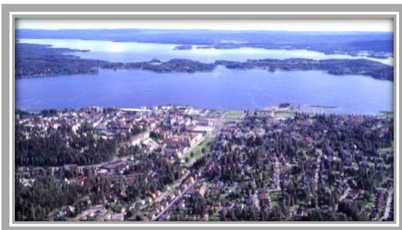
Kyrkviken i Arvika