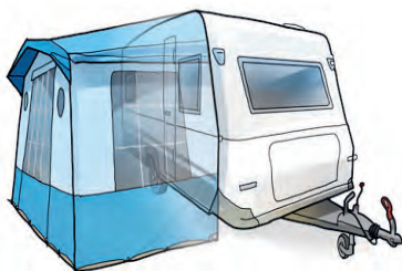
Exempel på campingfordon.