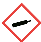
I. Gas under tryck