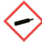
I. Gas under tryck